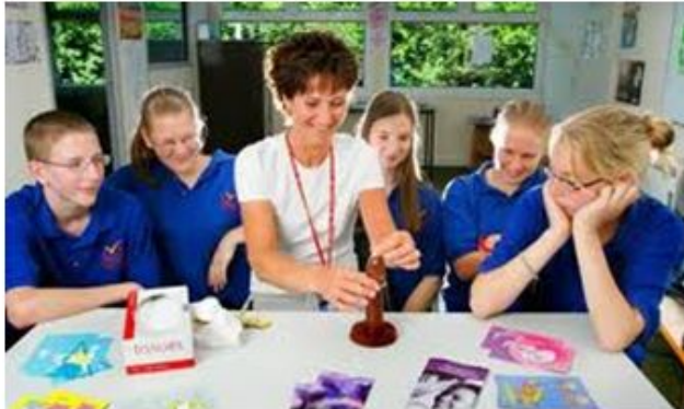
Sexuálna výchova na základných školách